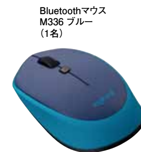
Bluetoothマウス M336 ブルー (1名)