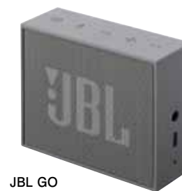
JBL GO ポータブルワイヤレス スピーカー (1名)